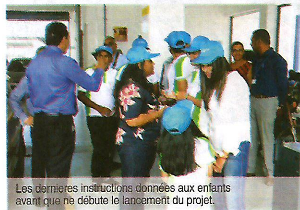
Les dernières instructions données aux enfants avant que ne débute le lancement du projet.