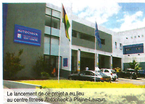
Le lancement de ce projet a eu lieu au centre fitness Autocheck à Plaine-Lauzun.